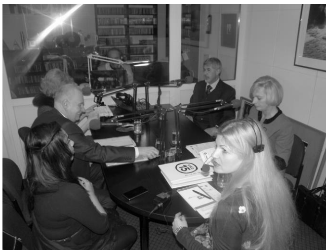
Diskusija Alytaus radijuje

Savaitės metu 155 organizacijos/institucijos organizavo daugiau nei 420 įvairaus pobūdžio renginių: mokymus, akcijas, atvirų durų dienas, atviras pamokas, kūrybines dirbtuves, meninės raiškos projektus, konkrečių veiksmų popietes ir vakarus, bendruomenių susitikimus, diskusijas ir kt. Savaitės renginiai Skyrių koordinatorių iniciatyva vyko visuose LSŠA skyriuose.