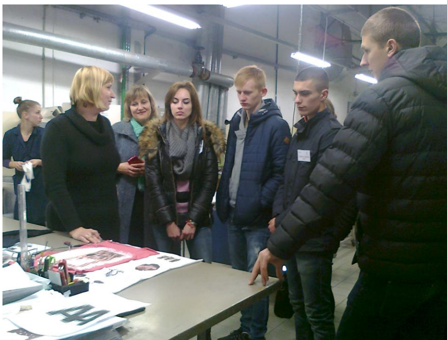
Savaitės renginys Utenos kolegijos studentai „Utenos trikotažo“ įmonėje